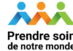
Tableau de bord / Cadre de référence favorisant la qualité de vie des communautés

Selon la démarche Prendre soin de notre monde