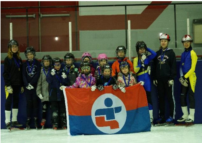
Activité Mes premiers Jeux : Mékinac