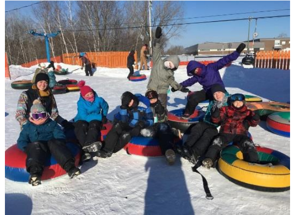
Jouer pour Jouer : Grand-Mère