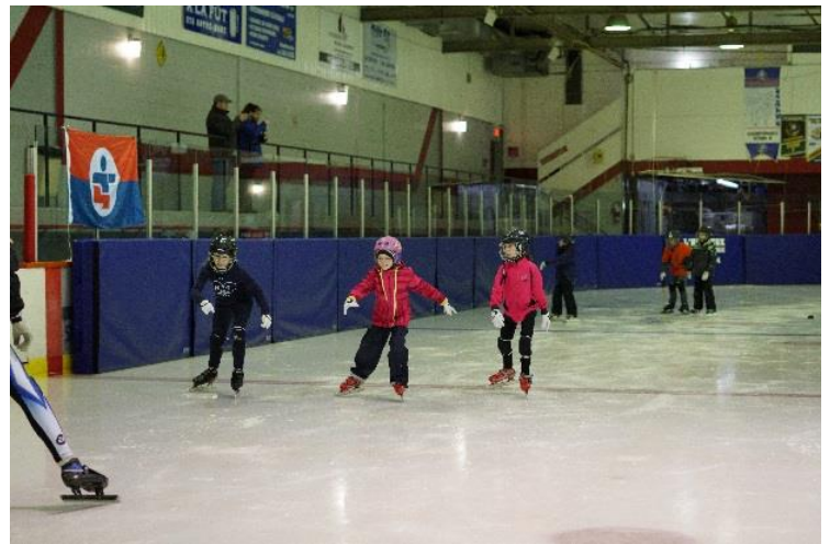
Activité Mes premiers Jeux : Mékinac